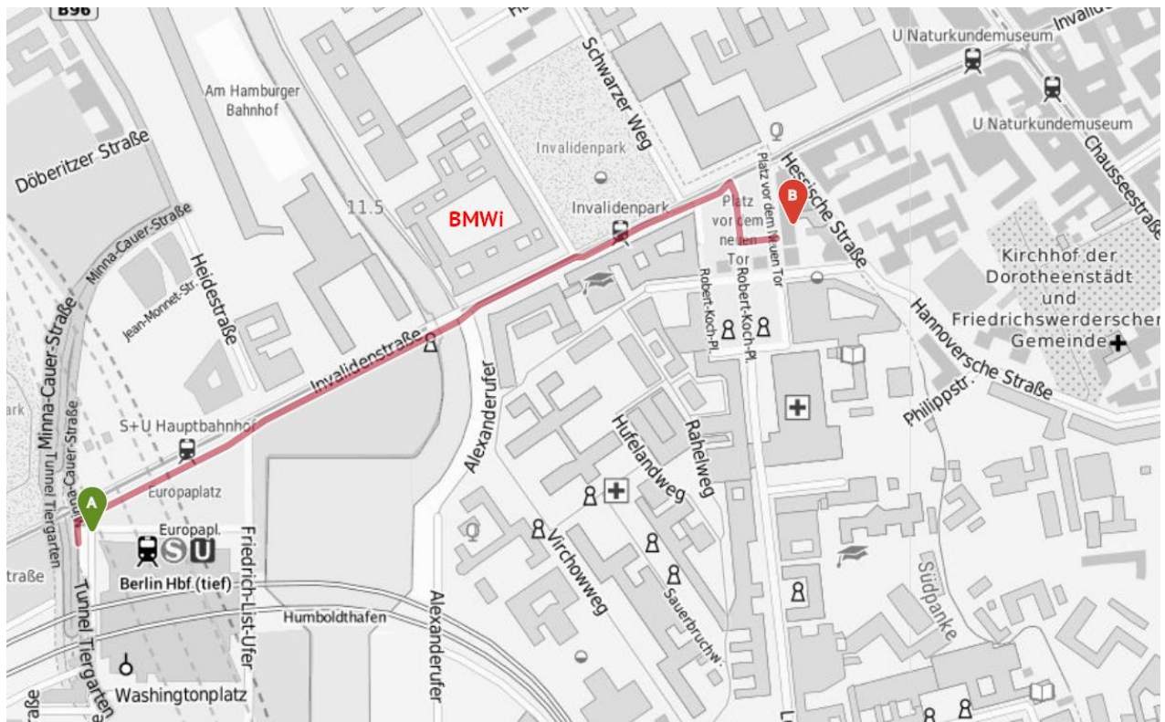
Karte: Bundesanstalt für Kartografie und Geodäsie, openrouteservice.org, OpenStreetMap contributors, MapSurfer.NET

Vor dem eingezeichneten BMWi stoßen wir am Samstag zur „Wir haben es satt!“-Demo (dort findet die internationale Agrarministerkonferenz statt).